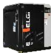
EN-serien, remdriven skruv 2,2–45 kW/0,26–6,85 m 3 /min