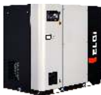
EG-serien, direkt driven skruv 11–250 kW /1,39–43,61 m 3 /min