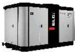
Oljefri-serien, skruv 45–450 kW/5,38–73,65 m 3 /min